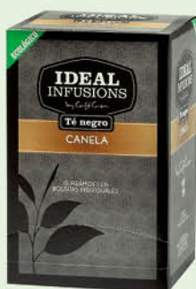
Te negre amb canyella