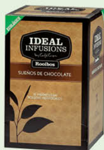
Rooibos "Somnis de xocolata"