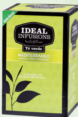
Te verd Mediterrani