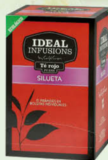
Te Vermell Silueta