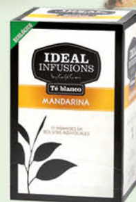
Te Blanc Mandarina