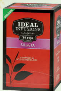
Te Vermell Silueta