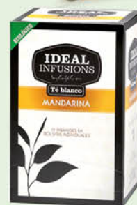
Te Blanc Mandarina