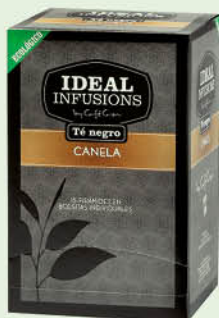
Te negre amb canyella