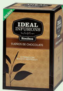
Rooibos "Somnis de xocolata"

La nostra àmplia gamma permet trobar la infusió adequada per al gust de cada client. Saludables, aromàtiques i de sabors variats i agradables.