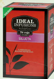
Te Vermell Silueta