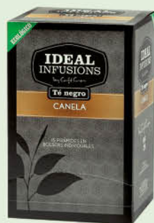
Te negre amb canyella