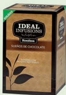
Rooibos "Somnis de xocolata"

La nostra àmplia gamma permet trobar la infusió adequada per al gust de cada client. Saludables, aromàtiques i de sabors variats i agradables.