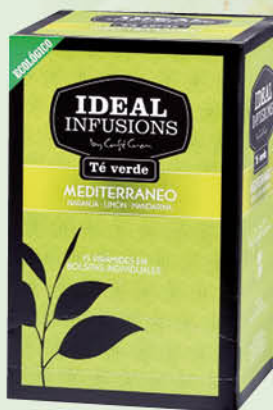
Te verd Mediterrani