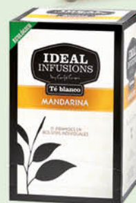
Te Blanc Mandarina