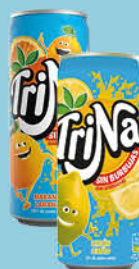
0,41 €/un. Trina Llimona / Taronja Llauna C-24