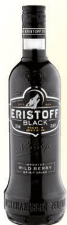
9,05 €/un. Vodka Eristoff Black 70 cl.