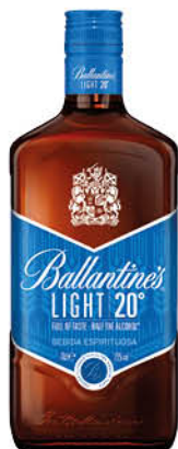
9,40 €/un. Whisky Ballantine's Light 70 cl.