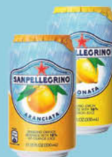
0,70 €/un. S. Pellegrino Limonata / Aranciata 33 cl. 16,80€/caixa C-24