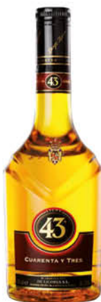
12,40 €/un. Licor 43 70 cl.