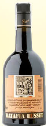
10,20 €/un. Ratafia Russet 70 cl