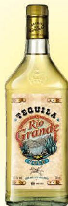
6,80 €/un. Tequila Rio Grande Gold 70 cl