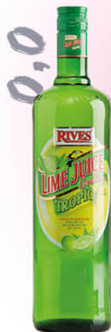
3,90 €/un. Llima Rives 1 L