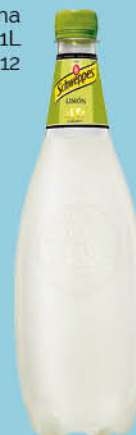
0,76 €/un. Schweppes Llimona PET 1L C-12