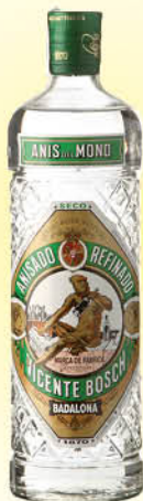
7,30 €/un. Anis del Mono Sec 70 cl.