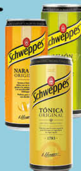
0,56 €/un. Schweppes Tònica llauna 0,33 cl. C-24