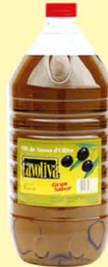
Tavola Oli Sansa 5 L.