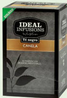
Te negre amb canyella