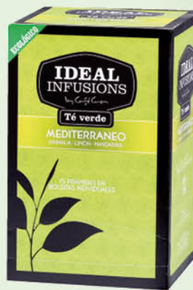
Te verd Mediterrani