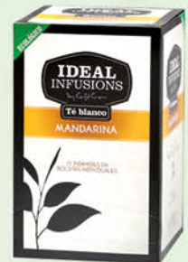
Te Blanc Mandarina