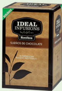
Rooibos "Somnis de xocolata"