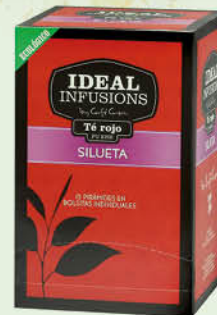
Te Vermell Silueta