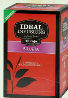
Te Vermell Silueta