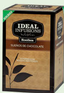
Rooibos "Somnis de xocolata"