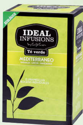
Te verd Mediterrani