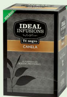
Te negre amb canyella