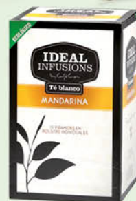
Te Blanc Mandarina