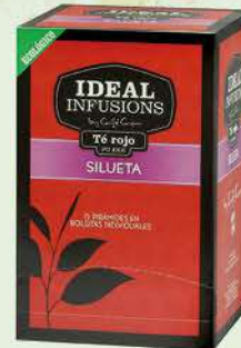
Te Vermell Silueta