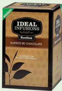
Rooibos "Somnis de xocolata"