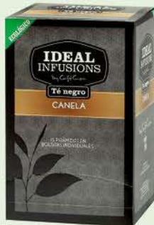
Te negre amb canyella