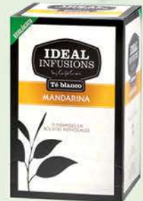
Te Blanc Mandarina