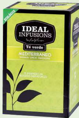
Te verd Mediterrani