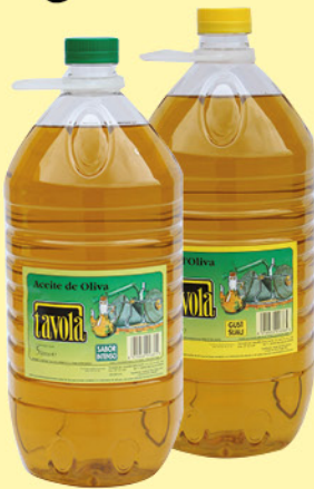
Tavola Oli Oliva Gust Intens 5 L.