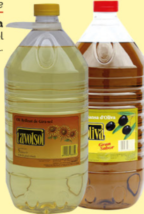
Tavola Oli Gira-Sol 5 L.