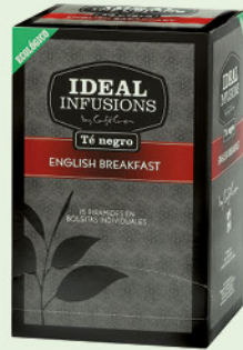
Te negre English Breakfast

Te verd amb ginebró i llimona / Te Negre Txai / Tilla / Te vermell / Te Negre English Breakfast / Digestiva / Te verd amb menta / Fruits del Bosc / Camamilla / Menta-poleo