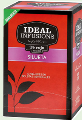
Te Vermell Silueta