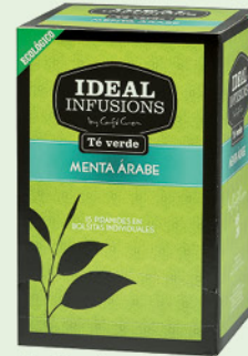
Te Verd amb Menta