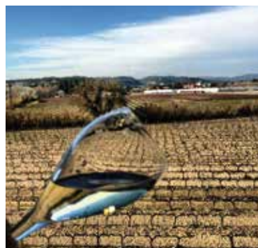
Agricultura. Generalitat de Catalunya, http://bit.ly/10bp1gT

El volumen de ventas del sector de los vinos y los cavas en Cataluña ha crecido hasta los 1.600 millones de euros. Lo indica un informe elaborado por la Generalitat a través d'Acció, que identifica un total de 853 empresas, cooperativas y autónomos con un volumen de negocio total de 1.600 millones de euros en 2013 (últimos datos disponibles).